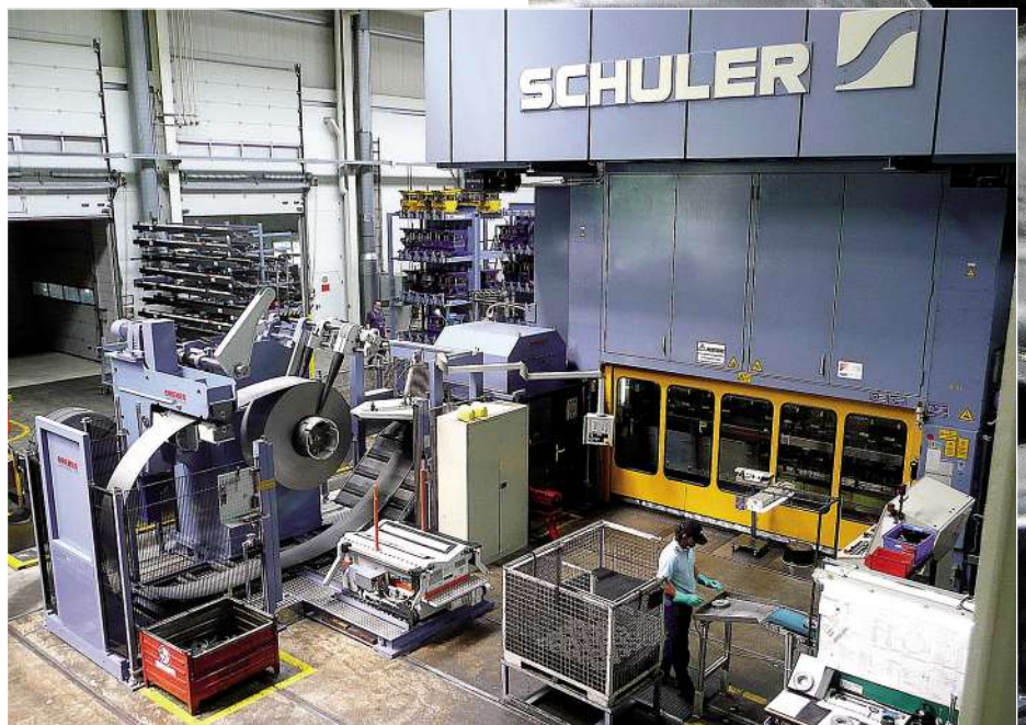
Arrangement des Dreher-Equipments um die bestehende Mehrstufenpresse, auf der die hochpräzisen Getriebeteile produziert werden. Das Band wird vom Coil abgewickelt und der Presse quer zugeführt.

Die Antriebsteile, die Schroth fertigt, sind absolute Präzisionsstanzteile, die später einmal in Premium-Automobilen verbaut werden. Gefertigt werden sie unter anderem auf einer Zwölf-Stationen-Stufenpresse. Um dieser freien Lauf zu lassen, muss die gesamte Peripherie bestens aufeinander abgestimmt sein. Das heißt, der gesamte Fertigungsprozess muss praktisch zur Symbiose verschmelzen, um danach die