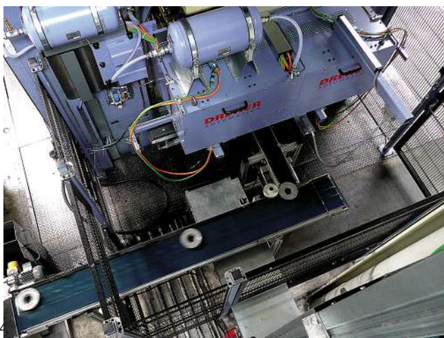
Von der Transferanlage werden die umgeformten Getriebeteile über ein Förderband einer Reinigungsstation zugeführt und danach in Gitterboxen für den Weitertransport einsortiert. Die Steuerung für den gesamten Produktionsablauf – vom Coil bis zum transportfertigen Bauteil – wurde von der Automatic-Systeme Dreher GmbH aus Sulz-Renfrizhausen realisiert.

Die Automatic-Systeme Dreher GmbH hat selbst seit mehr als 40 Jahren Erfahrung mit Automatisierungseinrichtungen für die Blech- und Massivumformung, wie die zahlreichen Anlagen für das Coil- und Platinenhandling auf der ganzen Welt beweisen. Die Anlage bei Schroth mit der gesamten peripheren Hardware sowie der komplexen Steuerung des umfangreichen Fertigungsprozesses war auch für die Dreher-Ingenieure wieder eine echte Herausforderung, die sehr gut bewältigt wurde.